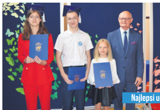
Najlepsi uczniowie SP Trzebielino