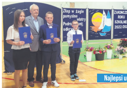
Najlepsi uczniowie SP Starkowo

Gratulujemy wysokich wyników w nauce i życzymy spokojnych wakacji.